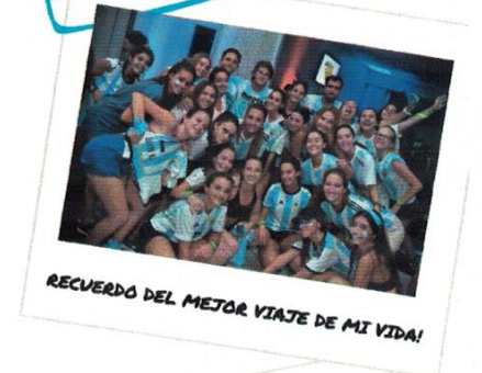
RECUERDO DEL MEJOR VIAJE DE MI VIDA!